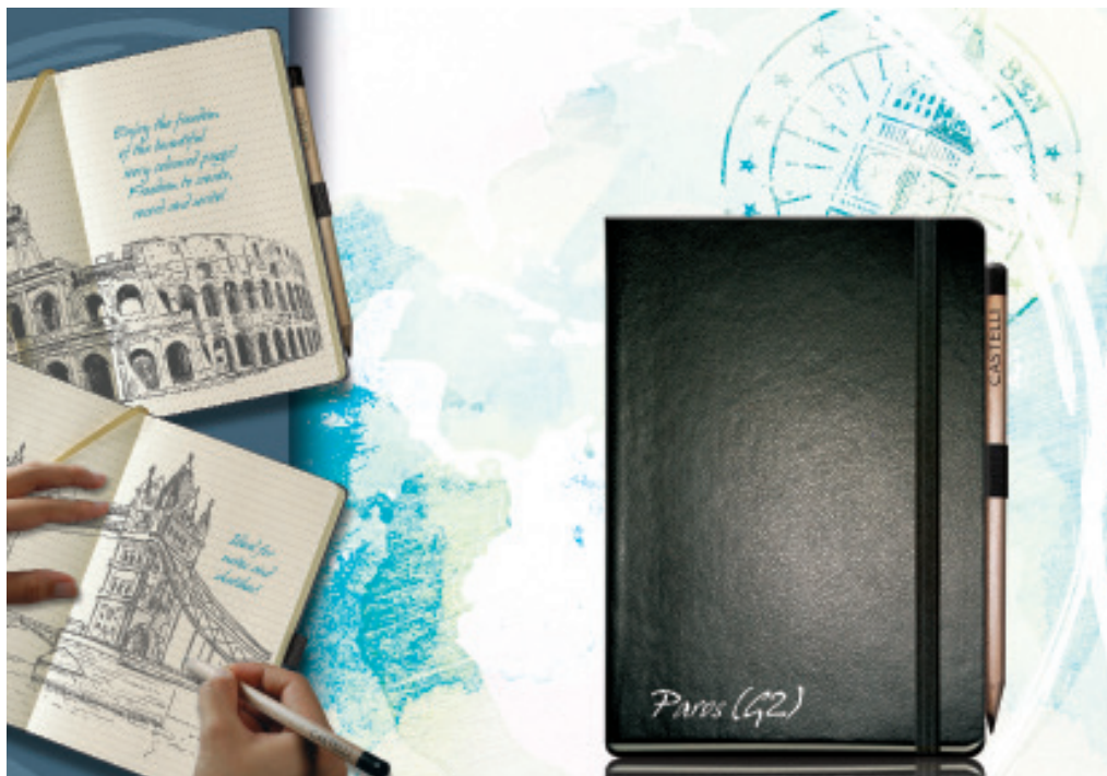
Notebook Paros de la collection « Ivory »