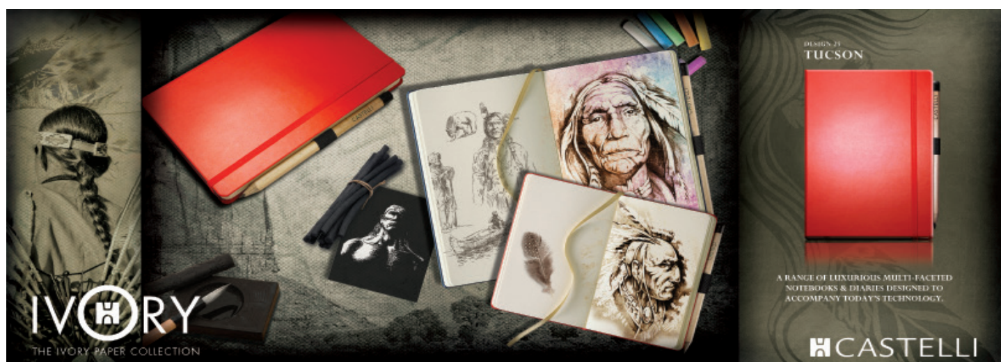
Notebook Tucson de la collection « Ivory »

Writer: Gérard Bourgeois www.creatis-conseil.com © 4D 2013. All rights reserved. Names and trademarks mentioned in this document are the property of their respective holders.